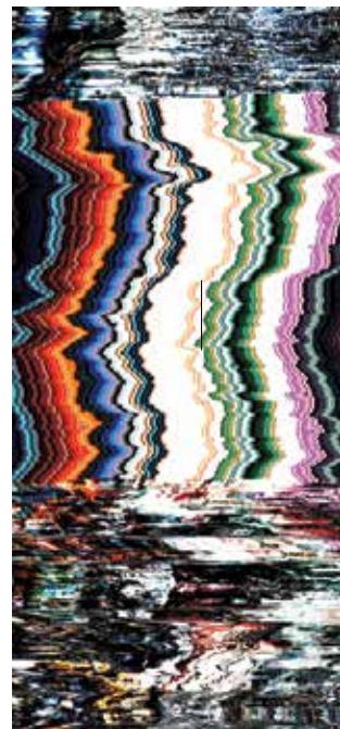
JEHAD NGA GREEN BOOK PROJECT 2012.

že. Ideja krajobraza u kontra-konceptualiziranom hiperprostoru postaje stoga neobično bitna. Kao sama ideja slike i njene uporabe kao metode ekspozicije lažne svijesti kapitalizma, uporaba krajobraza dovodi u neposrednu blizinu iznevjerenu ideju virtualne plaže. Formiranje kritičke biti vaporwavea postignuto je neposrednim eksperimentalnim iskorištavanjem dostupnog pastiša ideologema digitalne hiperinflacije obećanja kapitala u vremenu tehnološke apokalipse. Krajobraz, koji se pri tom pojavio kao mizanscena svih oblika spomenutog žanra, krasi izrazito avangardne tendencije. Zahtjev postavljen pred vaporwave sliku nije tek vizualiziranje i daljnje virtualiziranje njegova vlastita sadržaja nego recepcija onog isporučenog na način derealizacije originalnih učinaka slike i očiđenje spram sustava vrijednosti i značenja koje ovi unutar konvencije isporučuju. Zato je metoda vaporwave slike nužno kolaž, kritički remix, a mjesto u teoriji može pronaći u dekonstrukciji diskursa. Krajobraz je kao tema uopće, odnosno kao vizualna prisutnost doveden u krajnju (ne)prikazivost kroz operiranje i renderiranje virtualnih mogućnosti uspostavljanja krajobraza. Nepregledne pučine, beskran mrak na kojem se slažu konture neonskog post- Sci-fi grada koji se doimaju kao transparentne mreže, duboke i radikalno nedovršene perspektive jed-